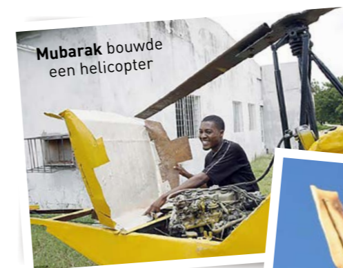
Mubarak bouwde een helicopter